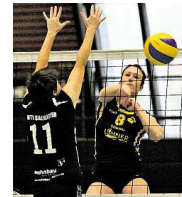
Erfolgreiche Saison für Schwarz-Gelb

Die Erstvertretung konnte sich nach einem überaus dramatischen Saisonfinale über den Oberliga-Klassenerhalt freuen, obwohl es in der letzten Partie eine Niederlage gegen MTV Salzgitter gab. 6 Siege in der Oberliga 2 der Frauen sorgten für 12 Punkte und damit für Platz 6 in der Abschlusstabelle.