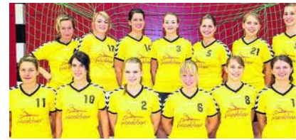
Erfolgsteam des MTV